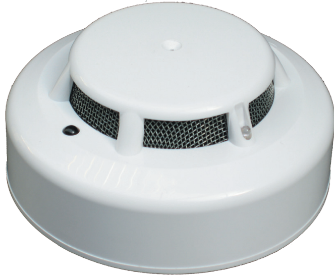
Détecteur ponctuel de fumée

BY AFNOR CERTIFICATION NF SYSTEME DE SECURITE INCENDIE www.marques-nf.com