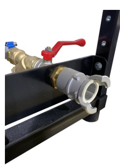
Raccord Sym. 20